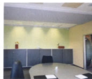
Die Raumfabrikanten präsentieren Raumkonzepte aus einer Hand.